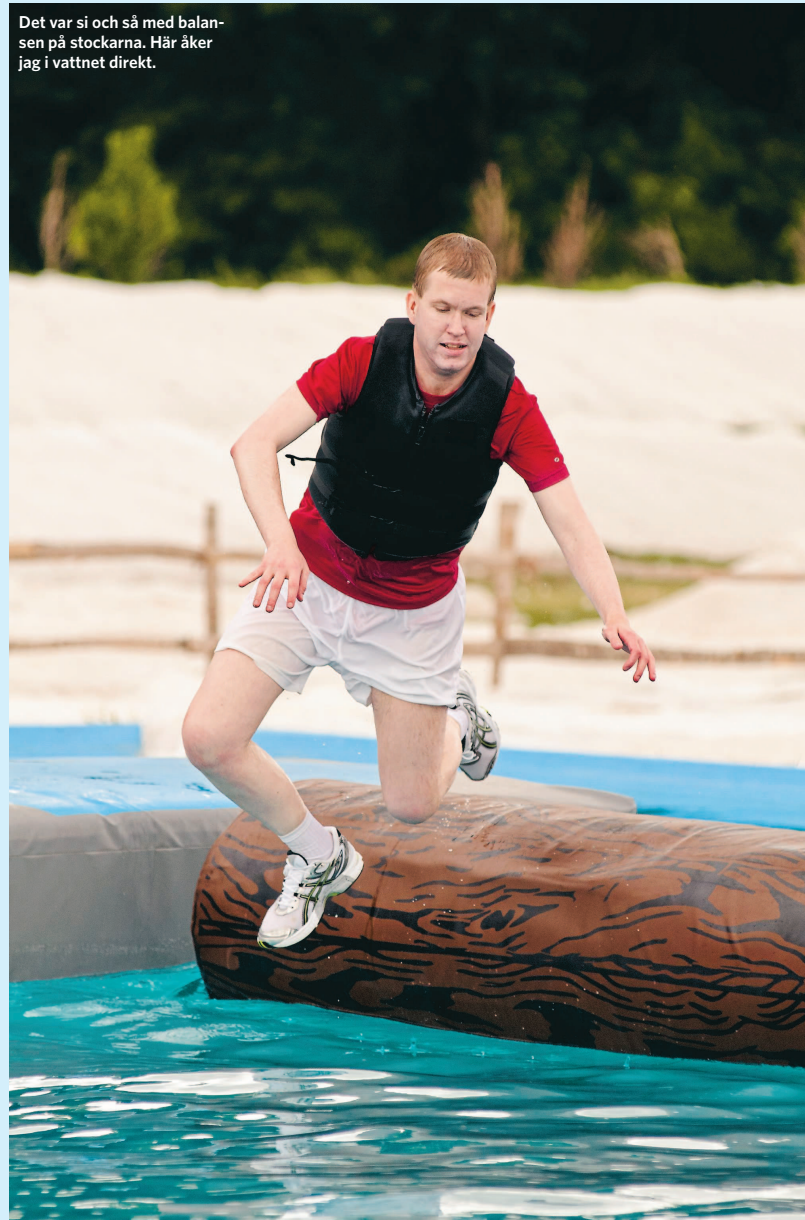
Det var si och så med balansen på stockarna. Här åker jag i vattnet direkt.