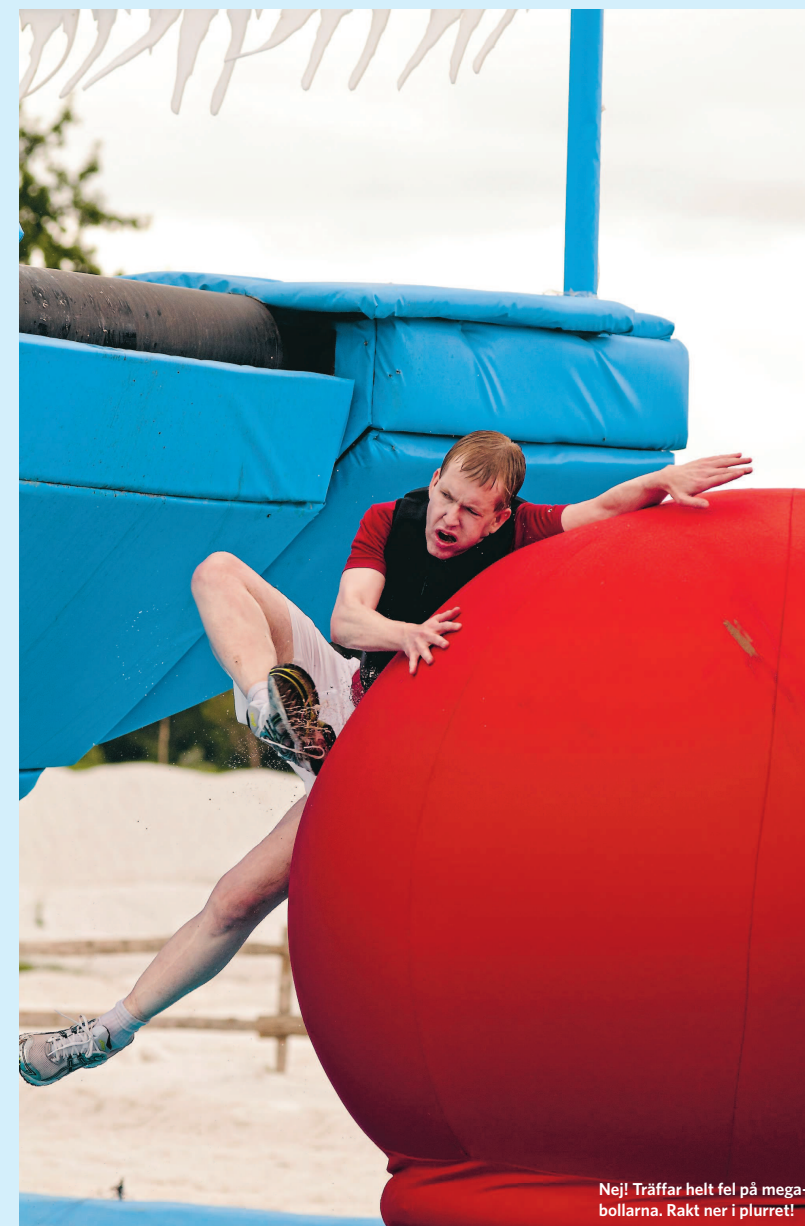
Nej! Träffar helt fel på megabollarna. Rakt ner i plurret!