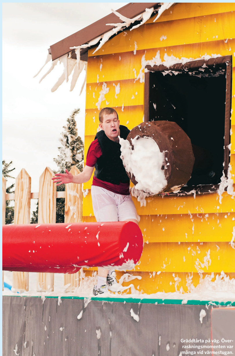
Gräddtårta på väg. Överraskningsmomenten var många vid värmestugan.